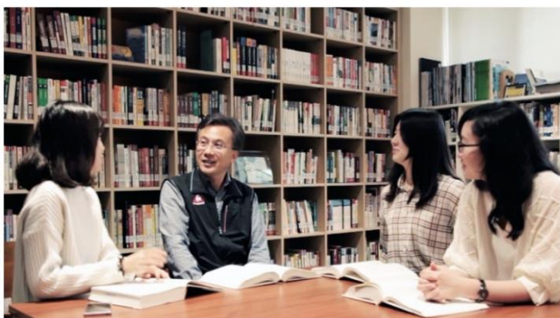
▲ 博雅書院師生共學、共思、共膳

如果能與未來的你相遇，你希望看見一個怎樣的自己？參與博雅書院的書院生，經過四年的書院教育進入職場，已漸漸在不同場域發光發熱。期望持續進修者，已然成為台大、交大、政大、成大、師大、陽明等大學或持續於東海攻讀之研究生，也有部分書院生申請通過至北京、上海、英國、美國等地進修。直接進入職場者，一一成為知名企業如：NIKE、鴻海、友達、裕隆、寶成、國泰、長榮、新光三越