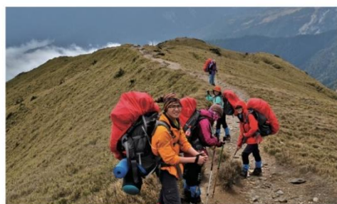
▲ 春季山訓等各項活動：預備書院生進行兩年自主方案學習之外領導力與團隊意識訓練。

在博雅書院的多元學習中，能夠參與跨領域的學習平台、跨科系的住宿學習環境、自主執行的專案學習機會、富國際視野的學習經驗。透過實際行動與體驗學習，將具有解決問題的整合能力。同時，書院將安排家族生活，由一群願意陪伴學生的老師，背景多元的朋友，組成家族。在學習的路上，你將有被支持的多重能量，且能學習與不同專業的夥伴溝通合作，未來進一步將經驗應用於實際職場生活中。把握進入博雅書院的學習機會，將充實你的大學生活，使你的學習，兼備高度與廣度，未來的人生發展，逐步邁向高峰。